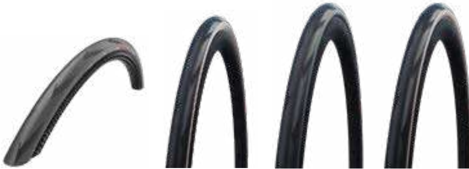
B11653974 - B11653975

Combina 'souplesse', velocità e controllo al massimo livello. Il migliore pneumatico da corsa che Schwalbe abbia mai sviluppato. Carcassa Super Race (costruzione Souplesse); Mescola Addix Race; Protezione contro le forature V-Guard. N.B.: Lo pneumatico TLE è stato appositamente progettato per l'uso senza camera d'aria e offre quindi le migliori prestazioni. Gli pneumatici TLE devono sempre essere utilizzati con il liquido sigillante.